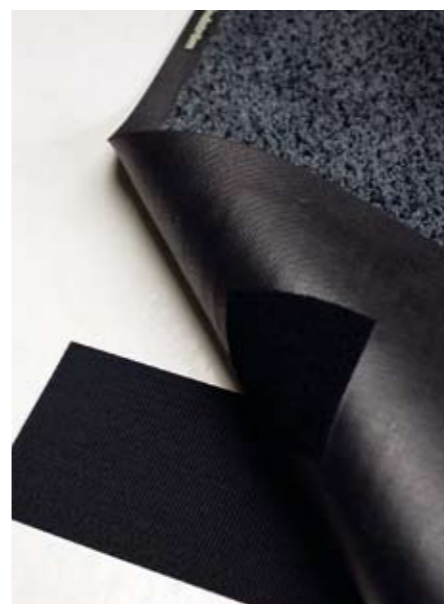
Tépozárás rögzítés A padlóhoz tépozárral való rögzítés még teljesebb biztonságot nyújt az elcsúszás ellen