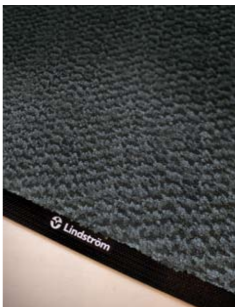
Nylon rostú szőnyegek Színek: Bazaltkék Méretek: MBW1: 85x150 MBW2: 115x200 MBW4: 150x300

Az idő- és költségmegtakarításon túl a megfelelően kiválasztott és karbantartott bérelt belépőszőnyegek megakadályozzák a szennyeződés és a por belső helyiségekben történő terjedését, mérséklik a padlófelületek elhasználódását és rongálódását, továbbá javítják a belső helyiségek levegőminőségét. Közismert, hogy a belső helyiségek levegőjében található porszemek mennyiségének csökkentése védi mind az embereket, mind az eszközöket, különösen a számítógépeket. A Lindström szőnyegbérlet szolgáltatásai ilyen módon fokozzák a vállalati helyiségek tisztaságát, és ezzel hozzájárulnak a kellemes környezet kialakításához.